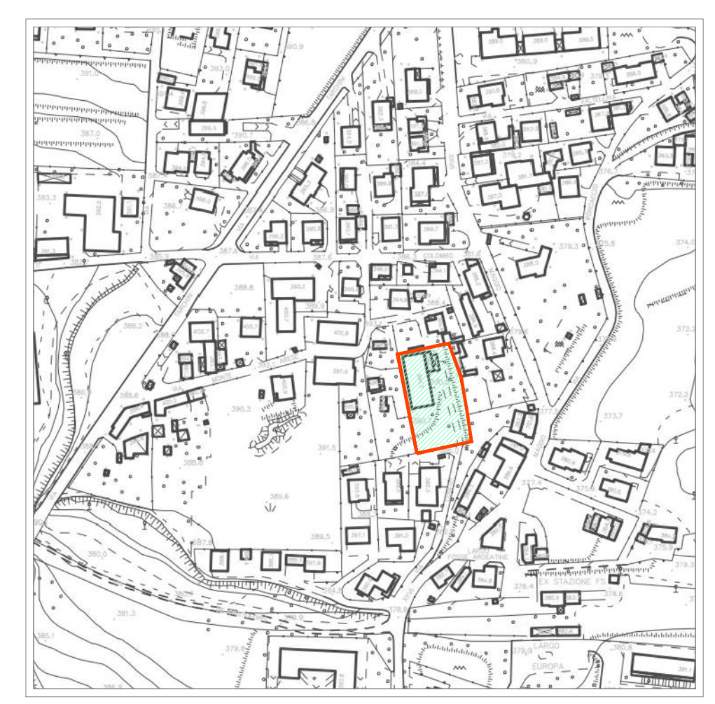
ESTRATTO VINCOLI AMBIENTALI Nessuna presenza di vincoli ambientali